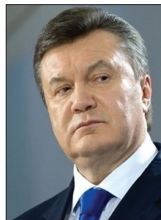
Віктор Федорович Янукович (Позбавлений звання Президента України у 2015 р.) 2010–2014 рр.